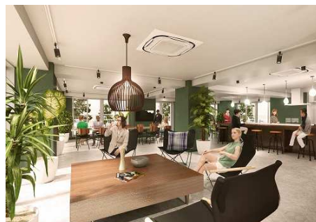
共用スペース イメージ