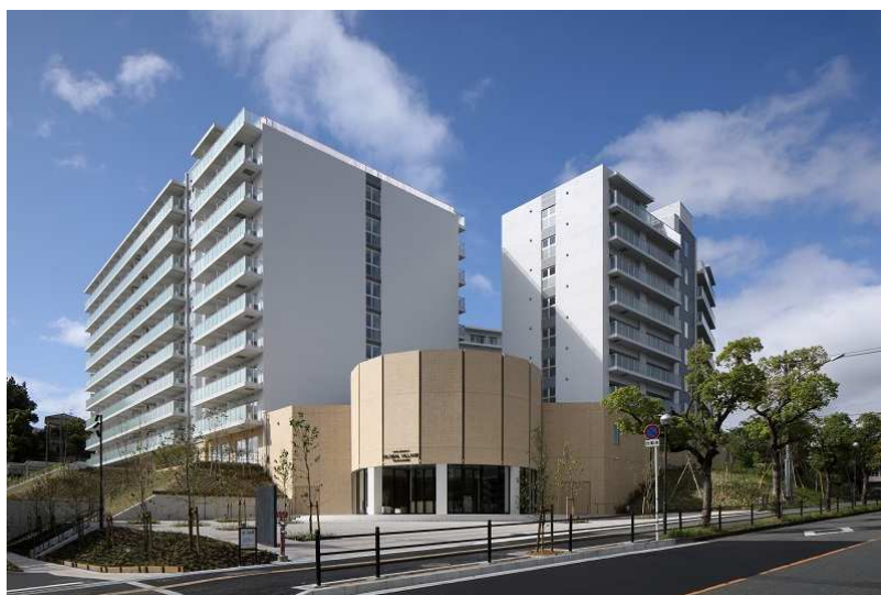
『大阪大学グローバルビレッジ津雲台』 国際学生寮・教職員宿舎 外観

同施設の事業は、上記3社が出資する特別目的会社(SPC)である、PFI 阪大グローバルビレッジ津雲台株式会社が担います。