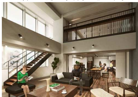
共用スペース イメージ

UDS 株式会社が運営するシェアハウス「ライツアパートメント」は、居室に水回り設備を備え、フロア毎に共用スペースを設置。充実した施設とともに、ゆとりある空間で交流ができる暮らしを提供します。また、ライブラリーやワークスペースなどの設備もあり、用途に合わせて自分らしい暮らし方が実現できます。